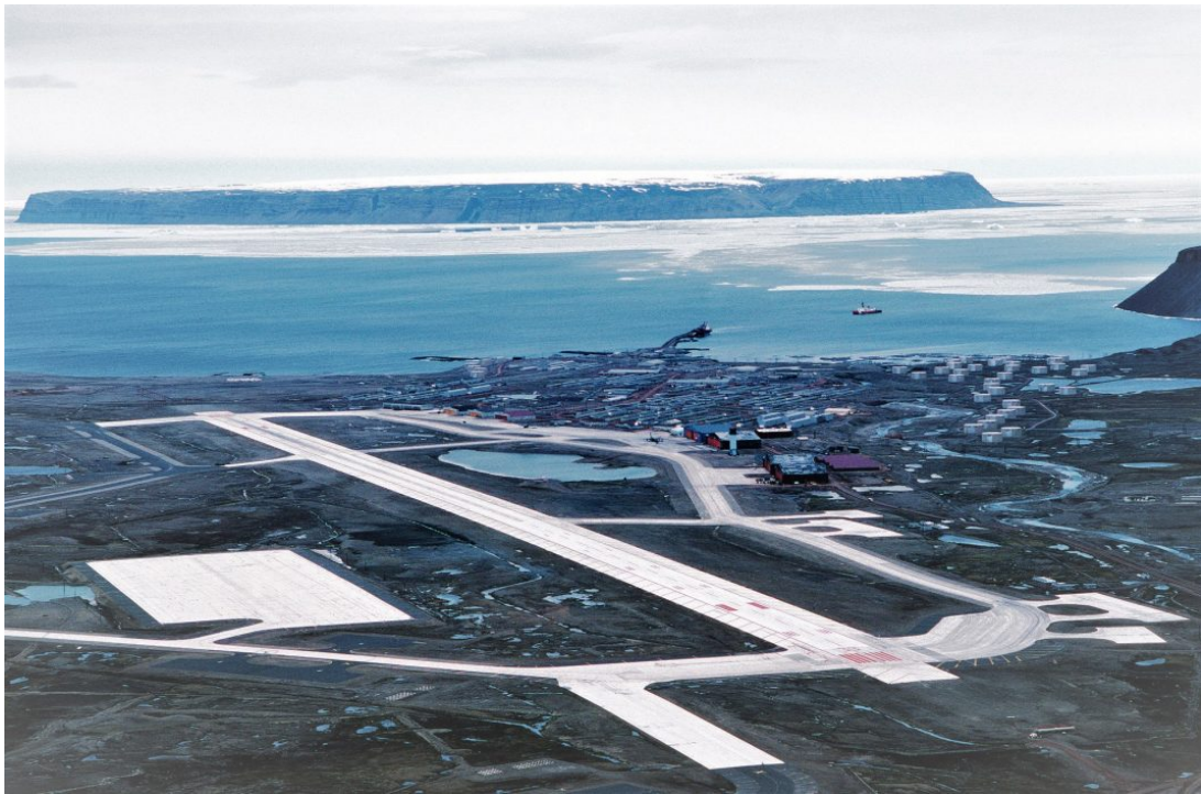
Thulebasen i det nordvestlige Grønland blev bygget i 1943, og huser stadig omkring 600 danske og amerikanske soldater. I 1980'erne var Jørgen Dragsdahl en af drivkræfterne bag den journalistiske undersøgelse af NATO's såkaldte 'dobbeltbeslutning', der handlede om opstillingen af mellemdistanceraketter på basen.